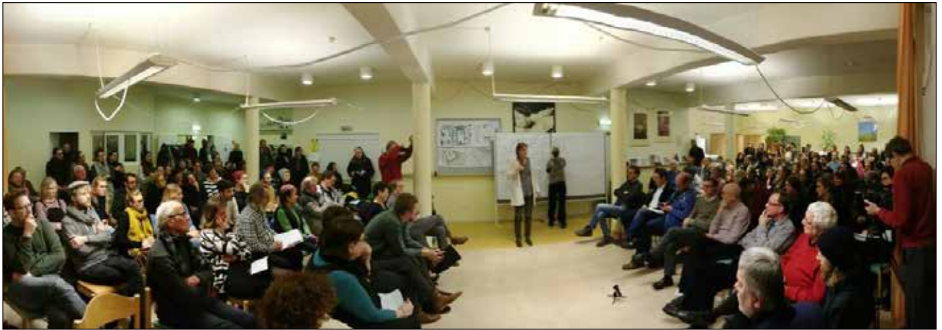
Herz As, 24.1.2017

Die VeranstalterInnen – ein Bündnis aus verschiedenen innenstadtnah zu verortenden Initiativen, weiteren Gruppen und dem Netzwerk Recht auf Stadt – waren selbst ein wenig überrascht, als sie am 24. Januar ihre Veranstaltung im »Herz As« eröffneten. Rund 130 TeilnehmerInnen sorgten für Überfüllung, viele mussten stehen. Das Thema des Abends: die soziale Stadtentwicklung rund um den Hauptbahnhof, so auch der Name des an diesem Abend de facto aus der Taufe gehobenen Aktionsbündnisses. Der Anlass: der drohende Verkauf und Abriss der vier Hochhäuser am Klosterwall und die Verhinderung der sozialen Umnutzung der seit langem leer stehenden ehemaligen Hörgeschädigtenschule im Münzviertel. Das Motiv: die Forderung nach einer sozialen Stadtentwicklungspolitik, die vorrangig auch die städtischen Räume für entsprechende Nutzungen vorhält, statt vorhandene Gebäude auch noch zu privatisieren und damit einer sozialen Nutzung absehbar zu entziehen.