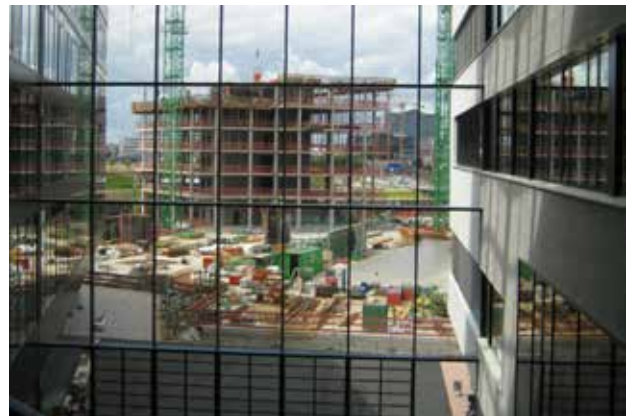
Blick aus dem HCU-Foyer